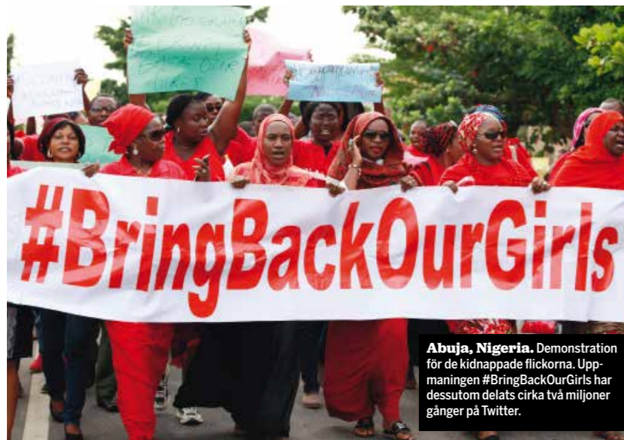
Abuja, Nigeria. Demonstration för de kidnappade flickorna. Uppmaningen #BringBackOurGirls har dessutom delats cirka två miljoner gånger på Twitter.