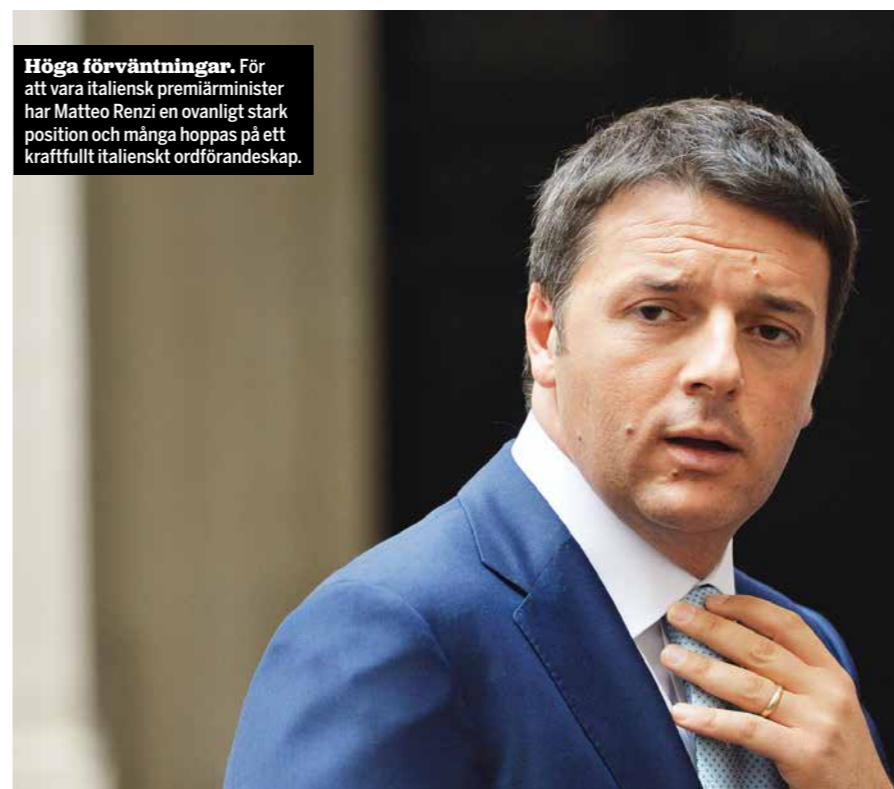
Höga förväntningar. För att vara italiensk premiärminister har Matteo Renzi en ovanligt stark position och många hoppas på ett kraftfullt italienskt ordförandeskap.