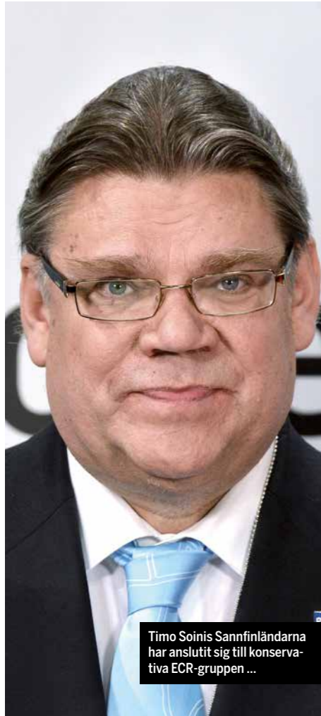
Timo Soinis Sannfinländarna har anslutit sig till konservativa ECR-gruppen ...