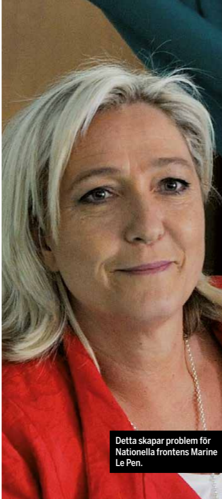
Detta skapar problem för Nationella frontens Marine Le Pen.